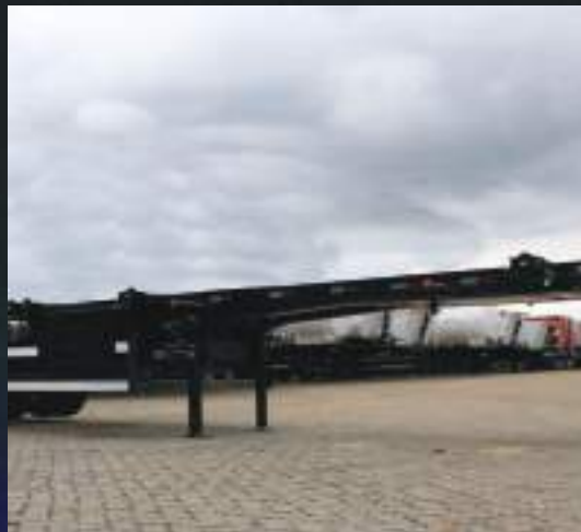
Chassi leve e reforçado