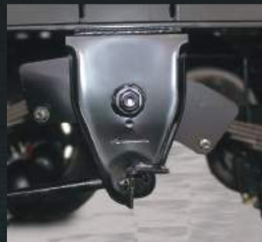
Balancim auto-lub. Não necessita de lubrificação.