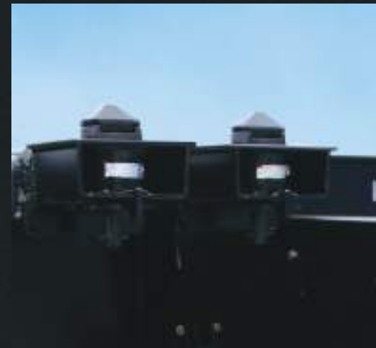
Engates contêiner normatizados.