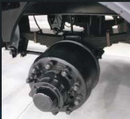
Eixos com cubo outboard e dois rolamentos grandes. Manutenção dos freios sem retirar o cubo do eixo