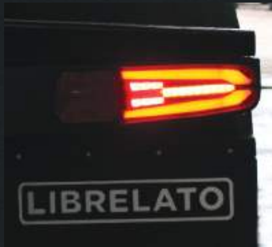
Lanterna traseira com design inspirado na linha automotiva e com indicação de direção sequencial