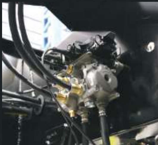
Sistema de frenagem totalmente integrado.