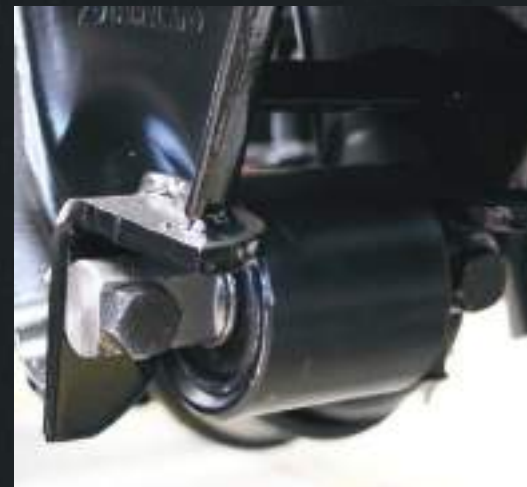
Buchas moleculares do braço tensor. Não desalinha.