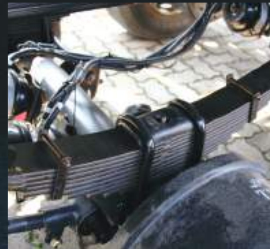
Molas redimensionadas e reforçadas