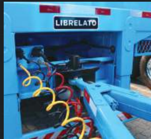
Engate e ponteira normatizada.