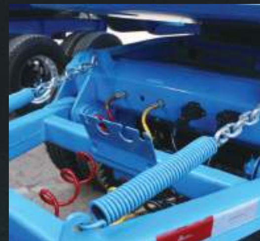
Cambão móvel articulado reforçado.