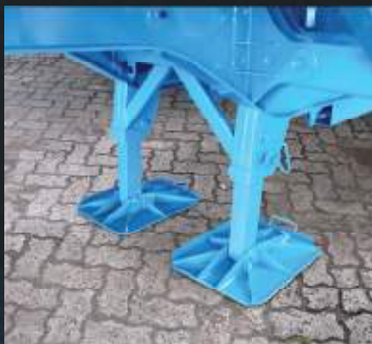
Sapata com acionamento pneumático. Opcional patola com acionamento eletro hidráulico.