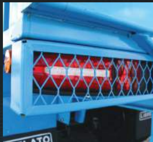
Sinaleira traseira com proteção metálica.