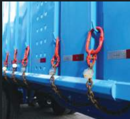
Correntes de içamento.