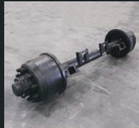
Eixos com capacidade técnica de 15 ton.