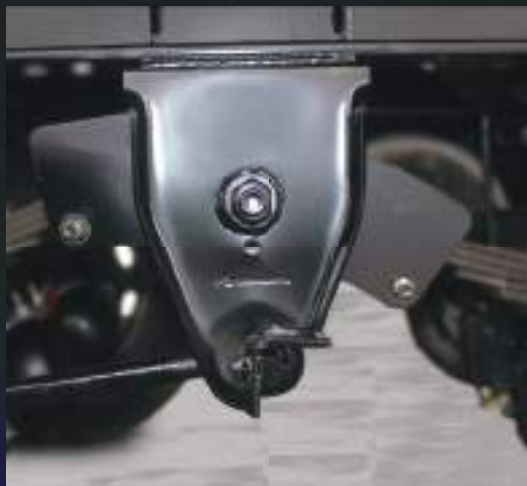
Balancim auto-lub. Não necessita de lubrificação.