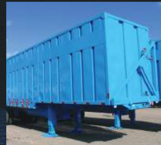
Caixa de carga em aço de alta resistência.