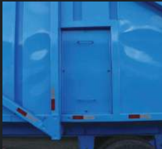
Abertura lateral lacrada.